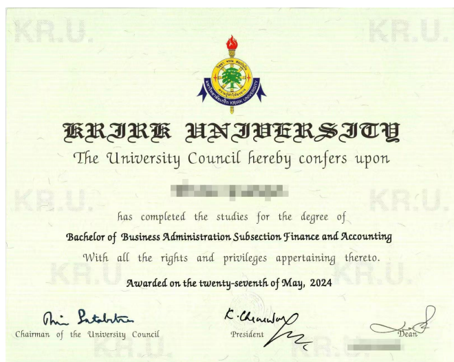
格乐大学学位证书